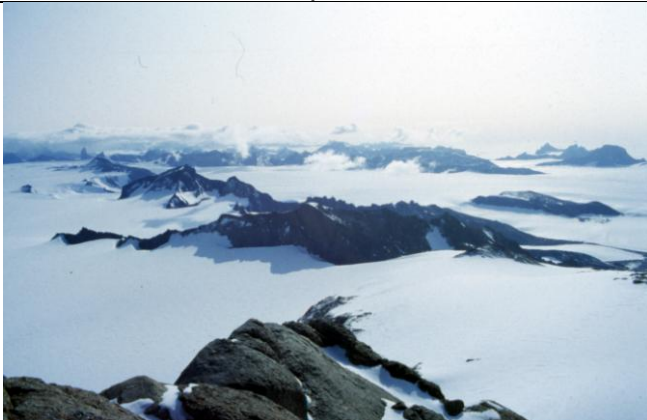
Blick vom Ritscher-Gipfel